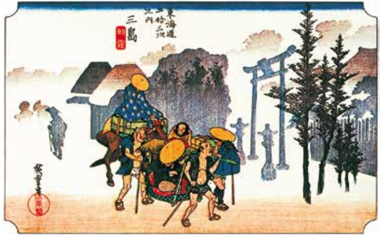
広重版画より 三島 朝霧